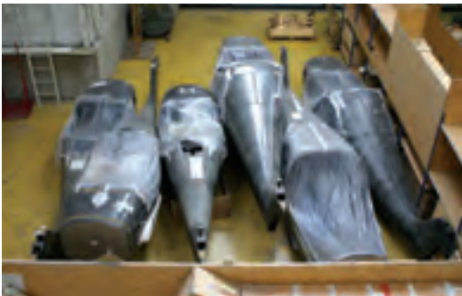
Voilures de MCR-4S et fuselages... La couleur noire indique l'usage des fibres de carbone...

Si la production de toutes les cellules de série intervient au Portugal, l'installation électrique et la finition des appareils sont réalisées à Dijon-Darois.