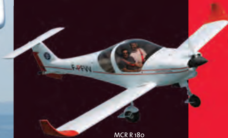
MCR R 180