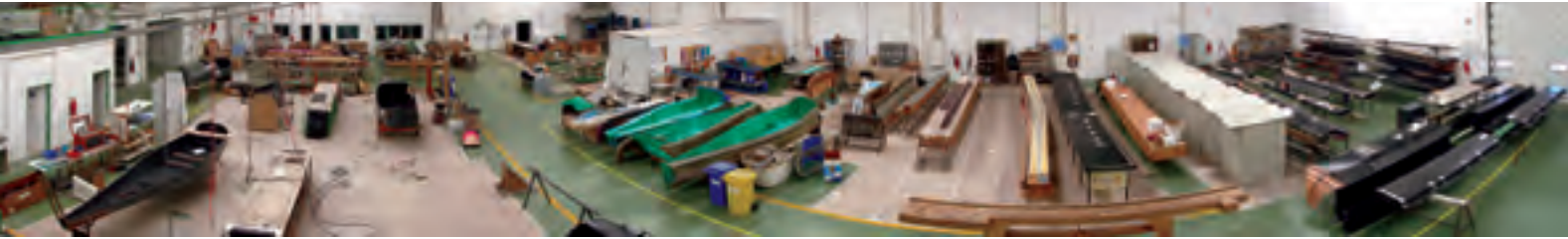
Vision panoramique d'une partie de l'usine implantée au Portugal.