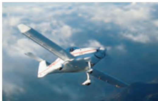
Le MCR-01, devenu VLA Sportster par la suite, utilise des flaperons assurant le roulis et l'hyper-sustentation.

Le MCR-01 est le premier appareil d'un concept qui va être décliné au fil des années, avec de multiples modifications et/ou améliorations, pour élaborer progressivement une gamme. L'industrialisation du MC-100 via le premier modèle de la gamme MCR constitue un tournant capital pour l'avenir de Dyn'Aéro, avec un important développement potentiel notamment grâce à des versions ULM livrées clés en main, contrairement au kit en bois des CR