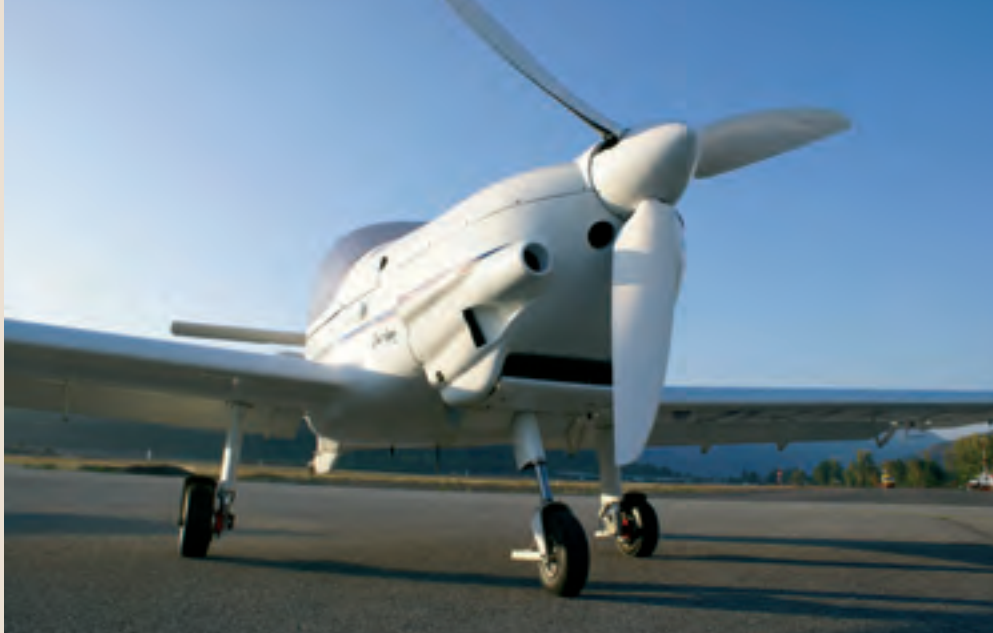
Le remorqueur R 100 répond à la réglementation suisse des Ecolight. Il utilise un Rotax 914 spécialement adapté à la cellule des MCR.