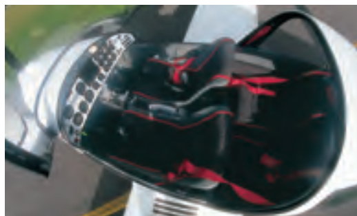
Le cockpit du 4S...