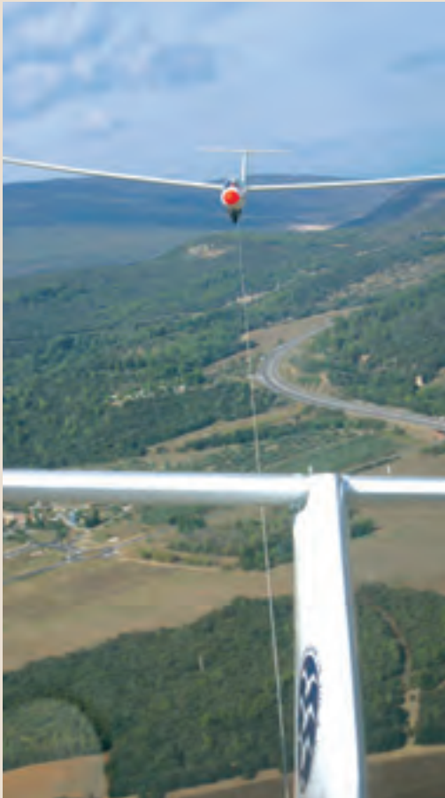
Visibilité totale vers le planeur remorqué pour le pilote...

procédure est simple. On dégage en virage et on réduit quasiment toute la puissance (PA 10"). L'installation d'essais, avec des sondes de température sur tous les cylindres, montre que le GMP ne souffre pas de ce traitement radical durant la descente. Il suffit ensuite de basculer un interrupteur pour enclencher l'enrouleur automatique du câble (le témoin lumineux de confirmation est peu visible) et de fermer les volets de capot. On peut alors descendre sous forte pente avec 200 à 210 km/h grâce à l'hélice petit pas, pour une VNO à 250 km/h et une VNO à 280 km/h.