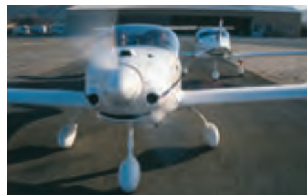
Ecole de base avec le MCR Club...

Ce nouvel avion est présenté comme la "quintessence" du savoir-faire acquis par la société durant ces quinze dernières années, avec un biplace proche au niveau de l'aérodynamisme du MCR VLA et incorporant toutes les évolutions menées sur les autres appareils : structure et commandes entièrement en fibres de carbone avec une masse à vide de base de 240 kg (280 kg équipé) pour 490 kg maxi, voilure à ailerons et volets à double fente séparés, parachute de secours en standard, système de carburant issu du 4S avec les réservoirs dans les ailes (2x60 l soit 6 h d'autonomie). Ainsi, le réservoir de fuselage disparaissant, l'équipage bénéficie d'un plus grand volume en cabine, avec un environnement proche de celui du 4S complété par un "glass cockpit" développé spécialement. Destiné au voyage rapide, le prototype est motorisé par le Rotax 914 de 100/114 ch issu du R 100 Ecolight mais le 912S reste possible. Complétée d'une hélice bipale à pas variable et commande hydraulique, la motorisation du biplace en kit est optimisée pour la vitesse en altitude avec 175 Kt de croisière visée au FL115 pour une consommation proche de 20 l de SP95. L'innovation technique provient de l'aile qui reprend le profil laminaire des MC-100, MCR-01, MCR VLA Sportster tout en adoptant les volets hypersustentateurs à fente et recul des ULM. Pour autoriser l'usage de pistes courtes et obtenir une large plage de vitesses, le bord de fuite est majoritaire-